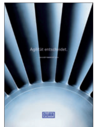
Dürr Geschäftsbericht 2010

In diesem Jahr nahm der Umfang der Druckwerke wieder zu: Deren Seitenzahl stieg leicht auf 191 Seiten, nachdem sie im vergangenen Jahr um 15% auf 188 Seiten deutlich zurückgegangen war. Hauptgrund für langfristig steigende Seitenumfänge sind die höheren IFRS-Anforderungen an den Anhang.