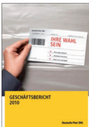
Deutsch Post DHL Geschäftsbericht 2010

Die Deutsche Post DHL erzielte den Gesamtsieg beim Wettbewerb „Die besten Geschäftsberichte“, den das manager magazin bereits zum 17. Mal veranstaltete. Maschinenbauer Gildemeister ist der Champion im MDAX, die Medizintechnikfirma Dräger nahm im TecDAX die Spitzenposition ein, der Anlagenbauer