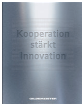
Gildemeister Geschäftsbericht 2010